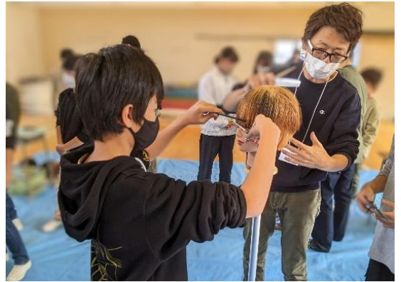
カット体験をする生徒

令和5年11月27日、静岡市立清水入江小学校において「後継者育成事業 理容体験」が開催されました。コロナ禍で開催できない年もありましたが、中部会青年部が行っている15年以上続いている体験学習です。今回は6年生4クラス130人弱の生徒さんと27人の理容師が参加しました。 まず最初に「実習で使う道具は実際お店で使用する道具なので大切にしてください。」と実習をする上での注意事項の説明がありました。刃物は生徒たちが思っている以上に良く切れる