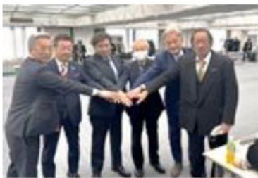
六県理事長一丸となって

組合の存在意義。私はこうした「仲間」がたくさんいて、万が一の時に助け合う組織であると再確認しました。不安な時、困ったとき、一人では何もできないけれど、傍に仲間がいる「心強い」存在であると思います。今号において県組合で契約している「組合顧問弁護士」や、「賠償責任共済」についてご紹介しております。営業支援ばかりでなく、こうした組合員サポートが大切な存在価値であると思います。