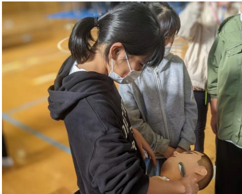
シェービング体験をする生徒

ます。怪我をしないためにも大切なことです。その後座学で理容師の基本的(理論)と美容師の違い・学校の事など)な事柄を学び実習に移りました。 カット・バリカン・アイロン・シェービング・パーマの4つのブースに分かれ、理容師1人で4人の生徒さんを担当します。どのブースの生徒さんたちも、お手本のようにはできずに悪戦苦闘しています。パーマコースの生徒さんは、理容師のアドバイスでロットが巻けるようになり喜ぶ姿が印象的でした。普段簡単にやっているように見える事が、実際に自分でやってみ